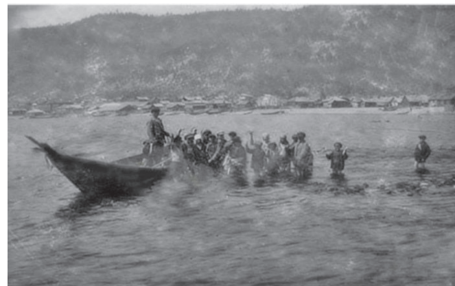
Ученическая бригада на ловле омуля

С начала войны все дети, начиная с 5 класса, трудились в летнее время. Были созданы детские неводные бригады - для младших школьников, а старшеклассники работали на сетях и на большом неводе. Вместе со взрослыми рыбаками подростки выходили в море, ставили сети, затем на «гребях» возвращались на берег. Для детей это был адский труд.