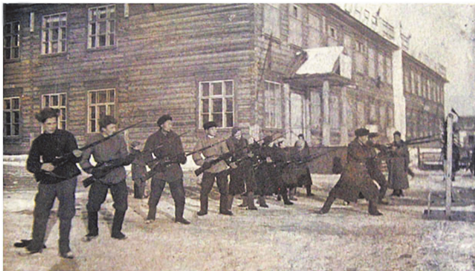
Урок военного дела. 1942г.

Яркими, интересными были школьные вечера. Работал драмкружок, ставили пьесы. Были хоровой кружок и школьный оркестр, поначалу «шумовой», потом школу премиривали музыкальными инструментами.